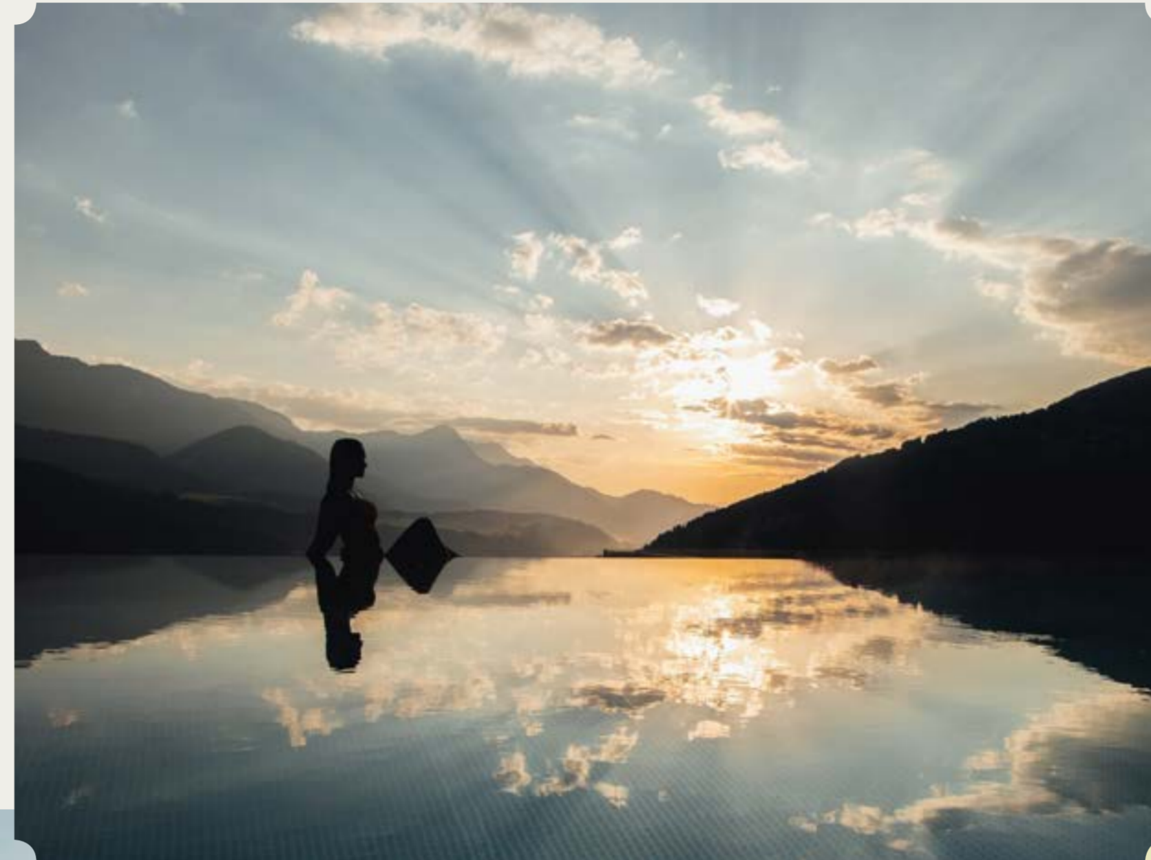
Infinity Pool 32 °C, 25 m

Wenn Sie sich lieber im warmen Wasser treiben lassen möchten, können Sie dies nicht nur in unserem 32 °C warmen Infinity Pool (25 m) tun, sondern auch in unserem neuen Warmwasserbecken bei angenehmen 35 °C . Der neue Pool hat einen traumhaften Blick auf Schladming und verwöhnt Sie mit einigen Sprudelbänken. Im Innenbereich erwartet Sie eine vergrößerte Finnenstube für mehr Platz bei unseren täglichen Saunaaufgüssen, und ein Dampfbad.